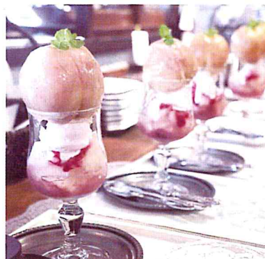
イチオシの季節のフルーツのパフェ 7月は桃パフェ

25年のお菓子づくりとアンティークの収集歴を活かし、今年4月にイングリッシュガーデンカフェを創業しました。季節の花や緑に囲まれたイングリッシュガーデンの中にたたずむ癒しの空間で、スイーツやドリンクを提供します。食材は、新鮮で安心安全な野菜や果物を地元農家から直接仕入れ、また、